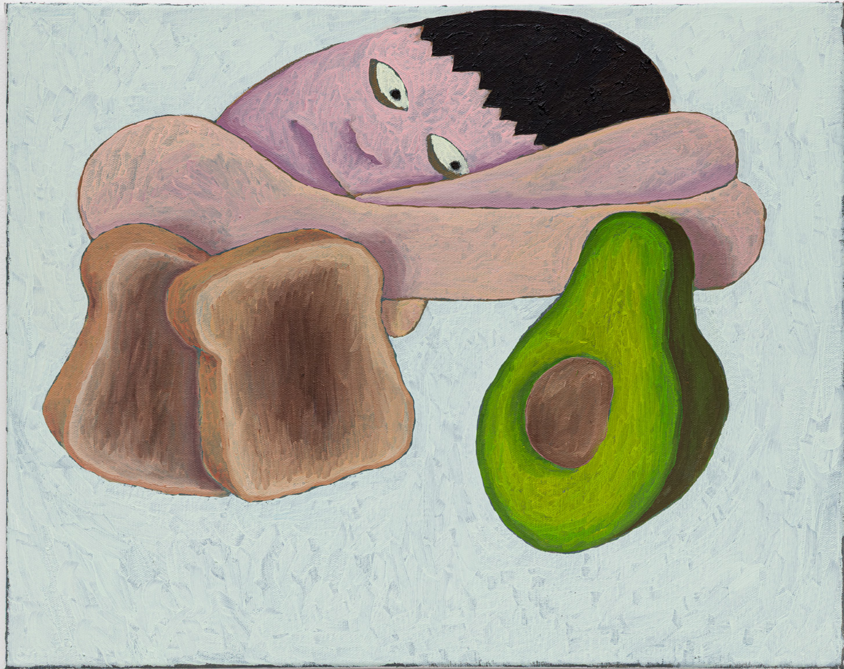
Ressaca, Torrada & Abacate, 2025

Óleo sobre tela [Oil on canvas] 40 x 50 cm [16 x 19 1/2 in] (FB0187)