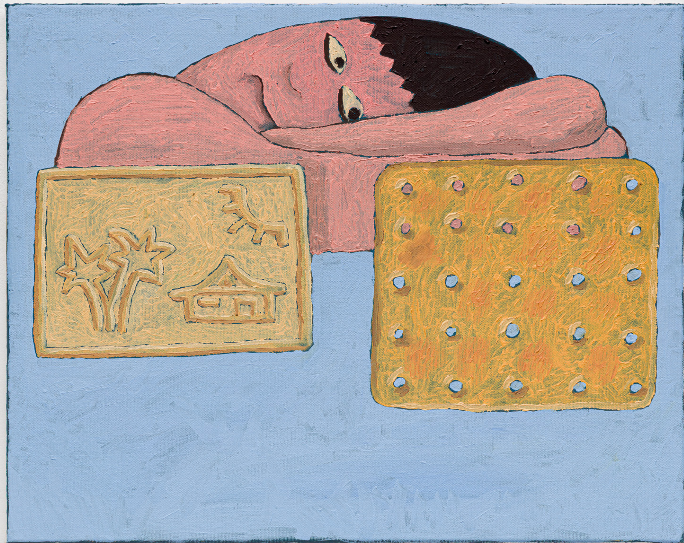
Ressaca, Biscoito & Bolacha, 2025

Óleo sobre tela [Oil on canvas] 40 x 50 cm [16 x 19 1/2 in] (FB0169)